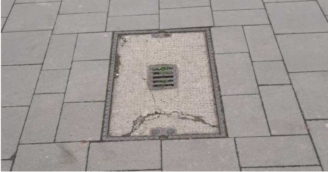
Schieberkappen und Hydranten mit Formsteinen: